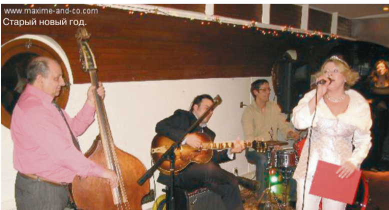
www.maxime-and-co.com Старый новый год.