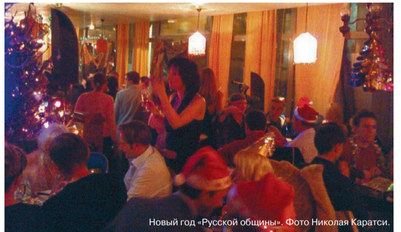
Новый год «Русской общины».