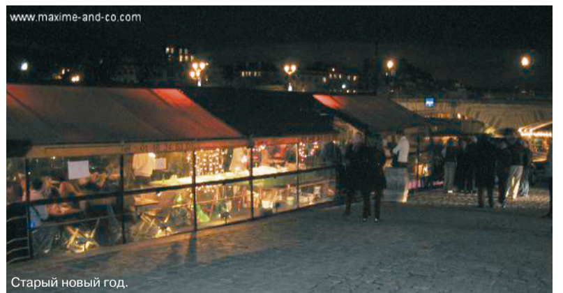
Старый новый год.

Иные наступают на экране и в жизни стр. 2