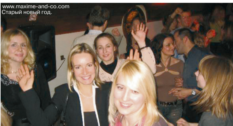
www.maxime-and-co.com Старый новый год.