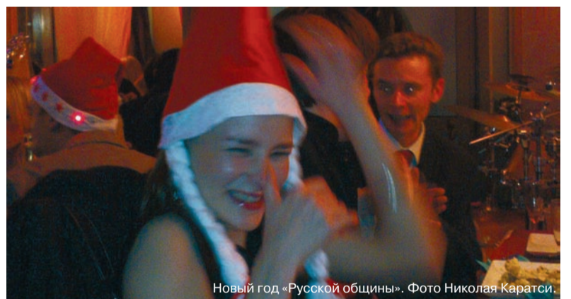
Новый год «Русской общины».