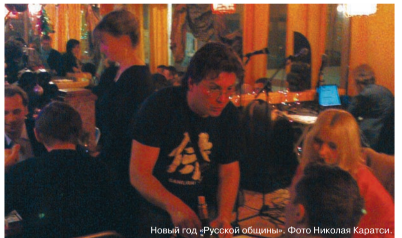
Новый год «Русской общины».