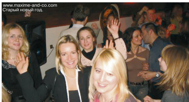
www.maxime-and-co.com Старый новый год.