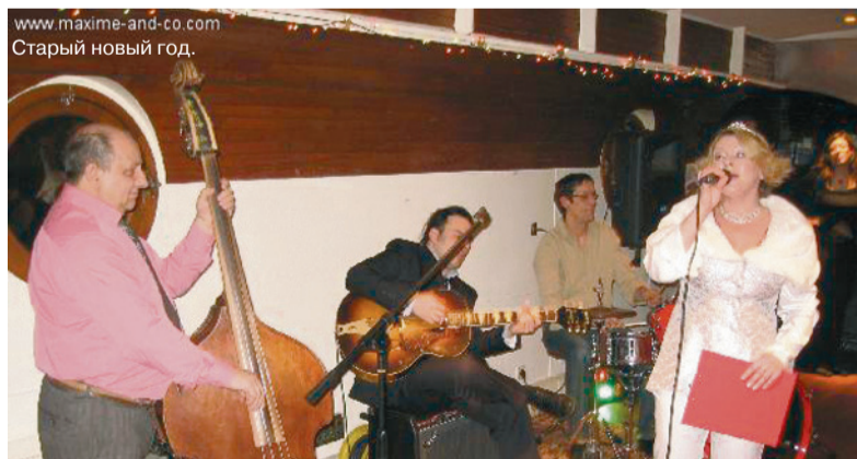
www.maxime-and-co.com Старый новый год.